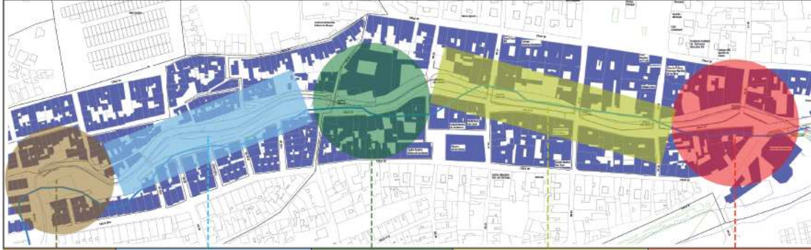
Área de intervención y sus zonas.