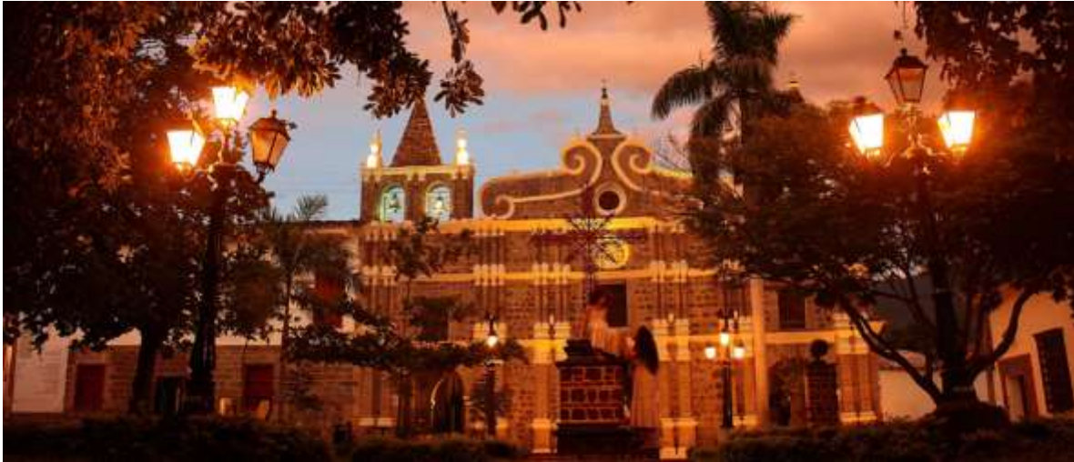
SANTAFE DE ANTIOQUIA