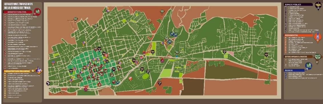
Plano de atractivos turísticos de Tunja.

ciudad y su accesibilidad, así mismo ampliar la información universal en inglés y español, de tales atractivos turísticos para peatones, el tránsito vehicular y poblaciones con capacidades especiales. Previendo un estudio de impactos del proyecto en términos urbanísticos, sociales, ambientales y turísticos y las acciones para mitigarlos o potenciarlos.