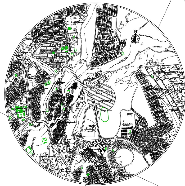
LOCALIZACION GENERAL ESCALA 1:10.000