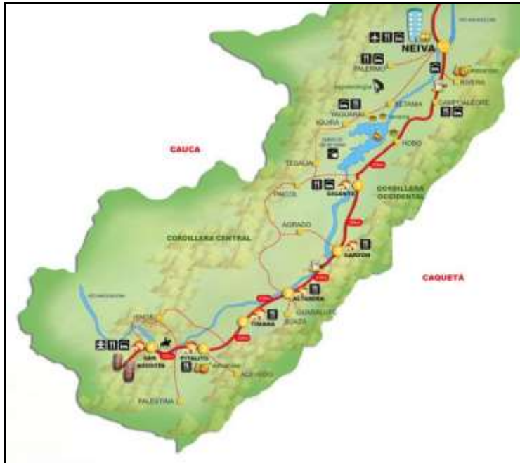
Departamento del Huila