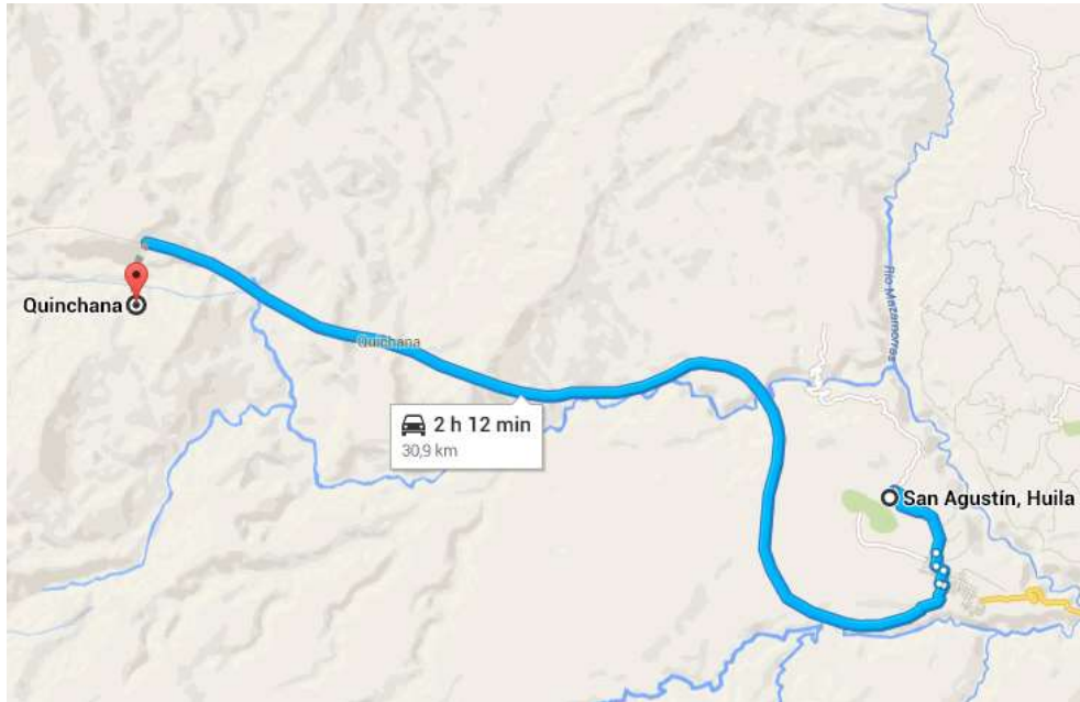
Localización de las áreas objeto de la contratación