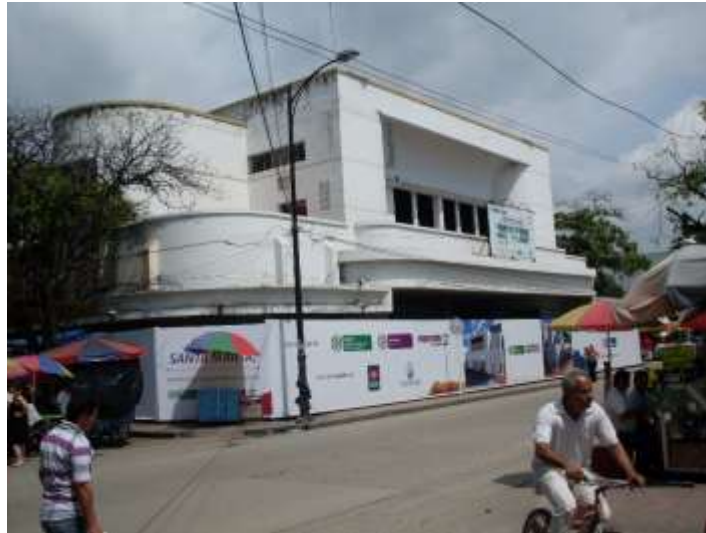
Teatro Santa Marta