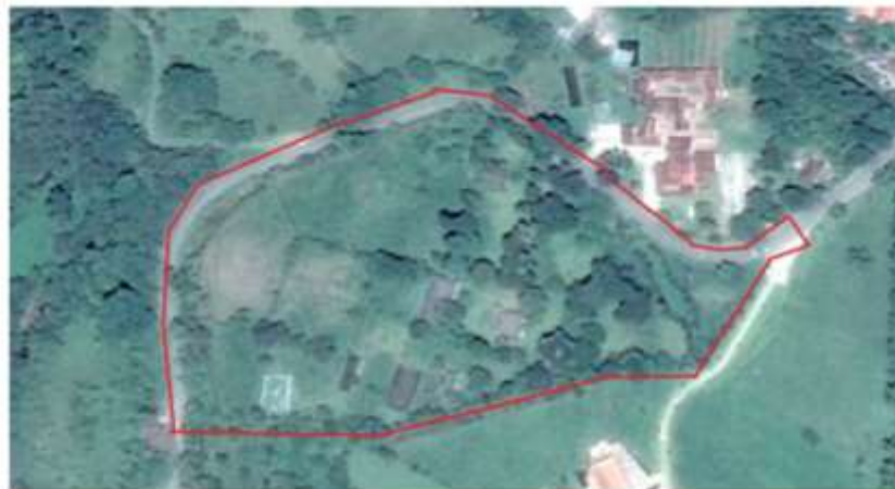
Imagen 1:Área de estudio