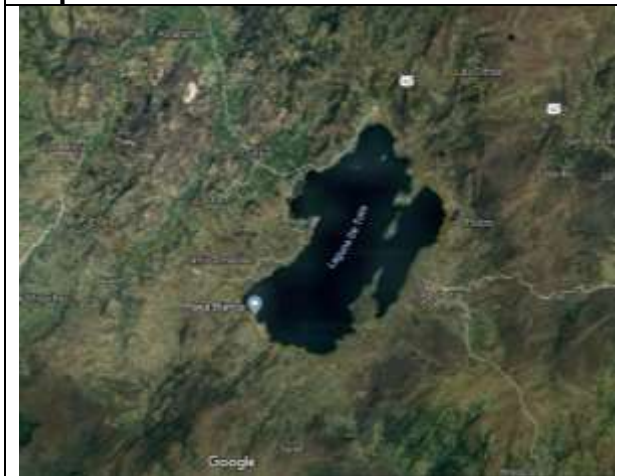
Imagen Aérea de Localización Playa Blanca – Municipio de Tota Boyacá

En desarrollo del Proyecto, el Patrimonio Autónomo - Fondo Nacional de Turismo FONTUR, suscribió el Convenio de Cooperación N° FNTIP-169-2017, cuyo objeto es "AUNAR ESFUERZOS HUMANOS, ADMINISTRATIVOS, FINANCIEROS, JURÍDICOS Y DE ASISTENCIA TÉCNICA PARA EL FORTALECIMIENTO ECOTURÍSTICO DEL ECOSISTEMA ESTRATÉGICO, PLAYA BLANCA LAGO DE TOTA, DEPARTAMENTO DE BOYACÁ" y con el fin de realizar la contratación derivada, adelantó el proceso de selección Invitación Abierta a presentar propuestas No. FNTIA-024-2019, en el cual se seleccionó el Contratista de Obra que llevará a cabo la "CONSTRUCCIÓN DE OBRAS DE INFRAESTRUCTURA EN PLAYA BLANCA, MUNICIPIO DE TOTA BOYACÁ", razón por la cual mediante la presente invitación, se pretende adelantar el proceso de selección para la contratación de la Interventoría de las obras mencionadas.