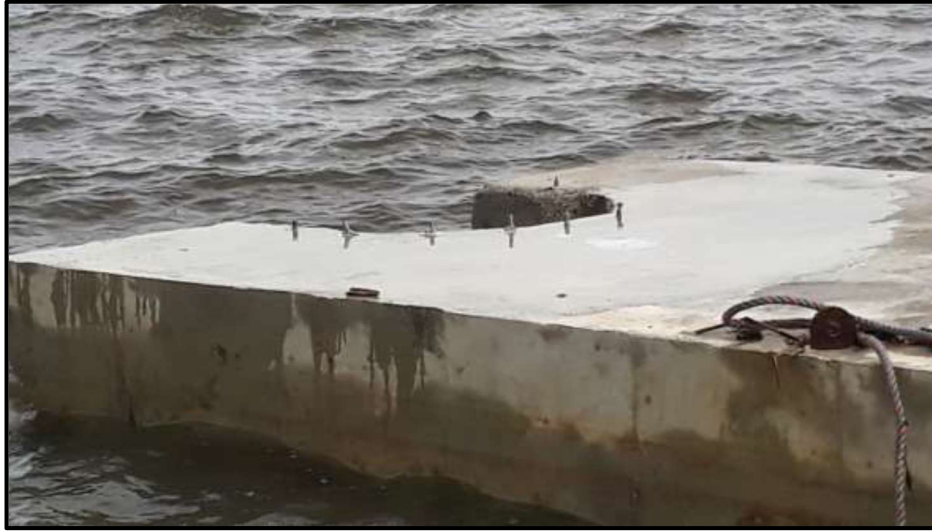
Figura 4. Estado de uno de los módulos de la barrera luego de que fuera desarticulado por el oleaje

“Es de anotar que la energía del oleaje presente en el área del proyecto, induce a sobreesfuerzo en los puntos de conexión de la barrera y por ende a los rodillos de alineación, por lo cual se optó por incrementar el sistema de anclaje de dichos puntos, con platinas y tornillos adicionales, con el fin de asumir de manera adecuada la energía de disipación del oleaje, sin embargo a pesar del mayor número de anclajes dispuestos se terminaron averiando de manera contundente, tal y como se puede observar en la imagen que se presenta a continuación:”