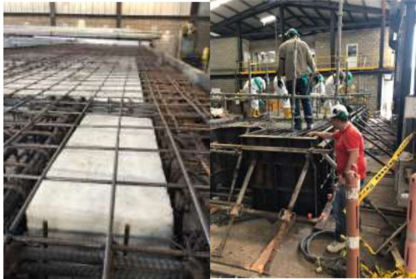
Figura 1. Seguimiento a la construcción de los módulos de la barrera anti oleaje.