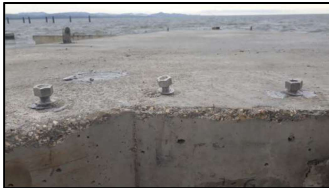
Figura 5. Estado de los pernos con los que se anclaron las platinas.

“Es de anotar que la energía del oleaje presente en el área del proyecto, induce a sobreesfuerzo en los puntos de conexión de la barrera y por ende a los rodillos de alineación, por lo cual se optó por incrementar el sistema de anclaje de dichos puntos, con platinas y tornillos adicionales, con el fin de asumir de manera adecuada la energía de disipación del oleaje, sin embargo a pesar del mayor número de anclajes dispuestos se terminaron averiando de manera contundente, tal y como se puede observar en la imagen que se presenta a continuación:”