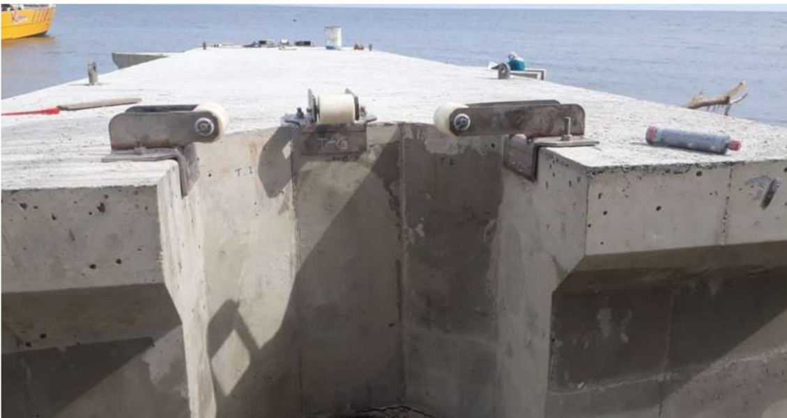
Figura 3. Instalación de platinas y rodillos en módulos de barreras.

“Durante el proceso de instalación de las barreras el oleaje desarticuló el ensamble de las secciones, doblando la tornillería y despegando las platinas de fijación de los rodillos de neopreno, como se puede evidenciar en la siguiente imagen:”