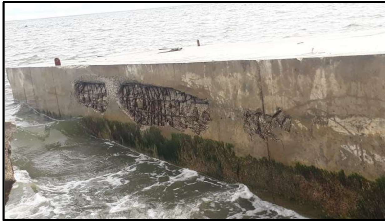
Figura 6. Estado final de uno de los módulos después de colisionar con otro módulo.

Esta falla resultó en que 3 de las 7 secciones que componen la barrera, se desacoplaran de los rodillos que componen el sistema de flotabilidad que fue severamente afectado y que produjo que dos de las secciones fueran sacadas abruptamente (a causa del fenómeno anteriormente citado) de su sitio de instalación y quedaran navegando a la deriva, para posteriormente impactar en su parte lateral con un vértice (punta) de otra sección que igualmente se encontraba en la playa produciéndose con ello pérdida de material que compone las paredes que contienen el poliestireno expandido:"