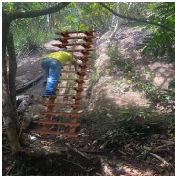
Construcciones de escaleras tipo gato con anclajes en roca