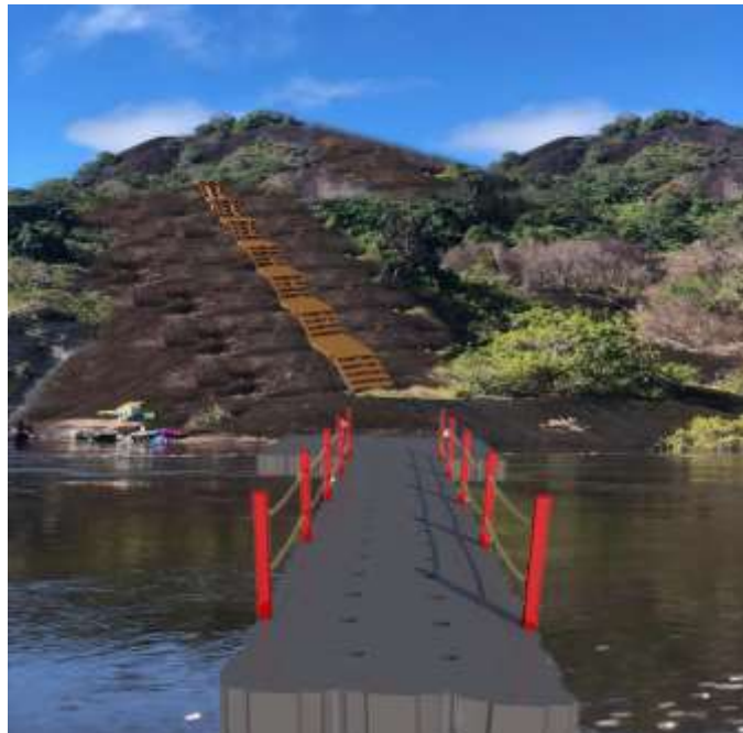
Construcción de muelles flotantes en módulos de cubos de polietileno expandido