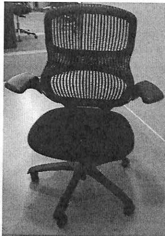
Foto referencia silla actual