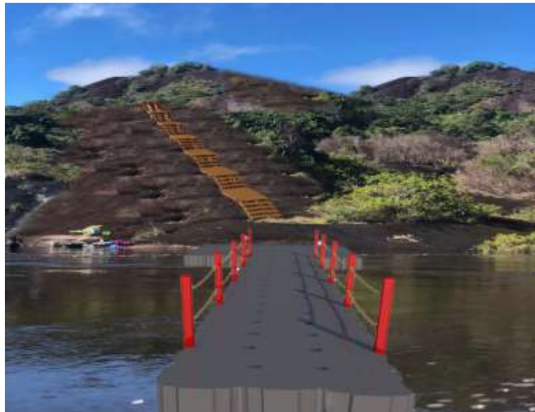
Construcción de muelles flotantes en módulos de cubos de polietileno expandido