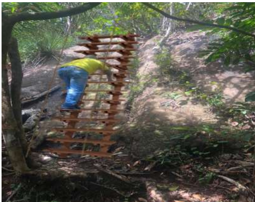
Construcciones de escaleras tipo gato con anclajes en roca