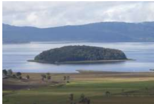
Panorámica Santuario de Flora Isla la Corota