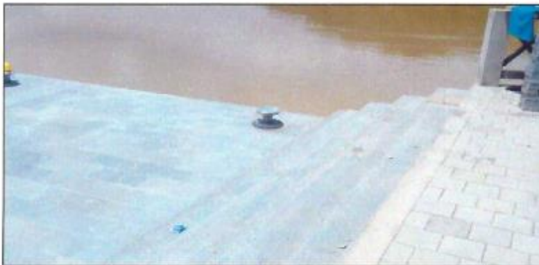
Noray instalados para el amarre de las embarcaciones al Muelle, localizado en el tramo 4.