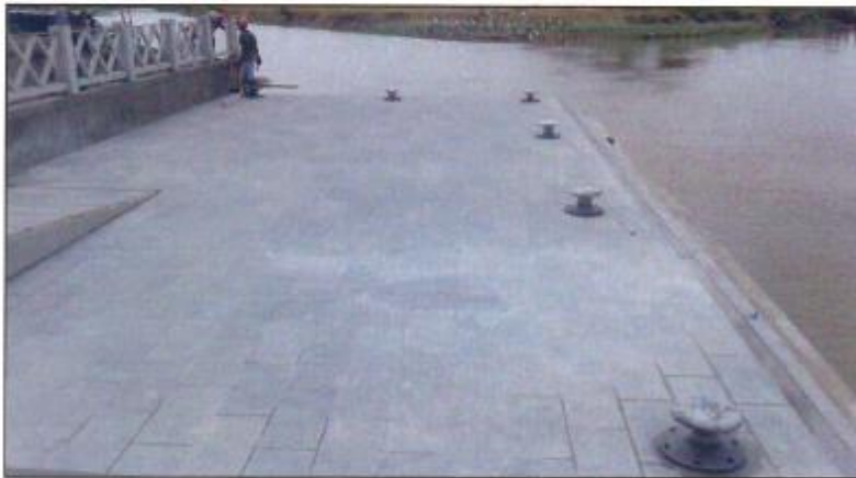
Losa de acceso a Muelle, se evidencian los Noray para el amarre de las embarcaciones.