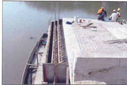
Formaleta para escaleras de acceso a embarcaciones del Muelle tramo 4.