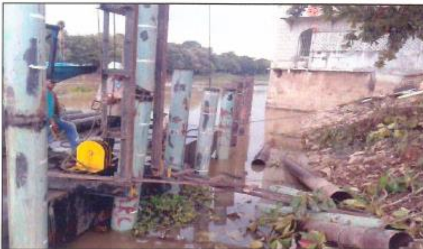
Inicio de proceso de pilotaje Muelle Affife en tramo 4 (Zona de Patrimonio).

Para mayor claridad del Comité Evaluador y supervisión de FONTUR, a continuación relacionamos un registro fotográfico, que hace parte de los informes que reposan en FONTUR, donde efectivamente se puede evidenciar que si se construyó el muelle tal y como se tenía contemplado, el cual es actualmente utilizado por las embarcaciones que navegan por esta zona, para desembarcar y embarcar sus mercancías y/o pasajeros, cumpliendo con las funciones de muelle tal como se construyó: