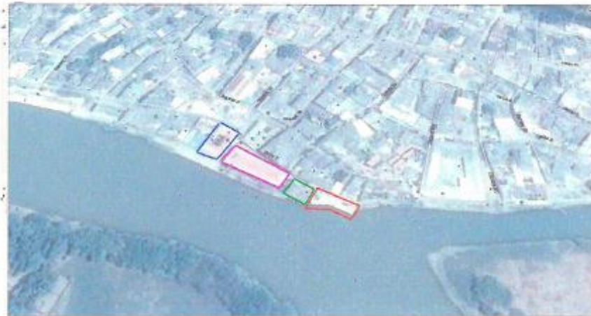
Imagen satelital actual de Google Earth del Malecón de Lorica - Córdoba, de izquierda a derecha: Azul: Edificio de la Alcaldía, Fucsia: Mercado público, Verde: Edificio de Affife, Rojo: Muelle de Affife o embarcadero como es llamado en la zona.

Adicionalmente, la construcción del Muelle de Affife dentro del contrato, está ratificada mediante la certificación expedida por la Alcaldía Municipio de Santa Cruz de Lorica, entidad contratante del Contrato de Obra No. 174 de 2014 el cual fue objeto de nuestro Contrato de Interventoría No. FNT-021-2015 , la cual fue anexada en nuestra propuesta a folios 296 a 298 , la cual manifiesta de manera textual lo siguiente: "Principales actividades ejecutadas dentro del objeto contractual: pilotes hincados, placa de concreto reforzado, barandas,