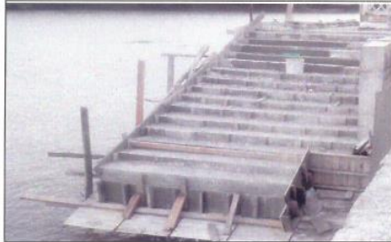
Escalera de apoyo para el para acceso a muelle de embarcaciones.