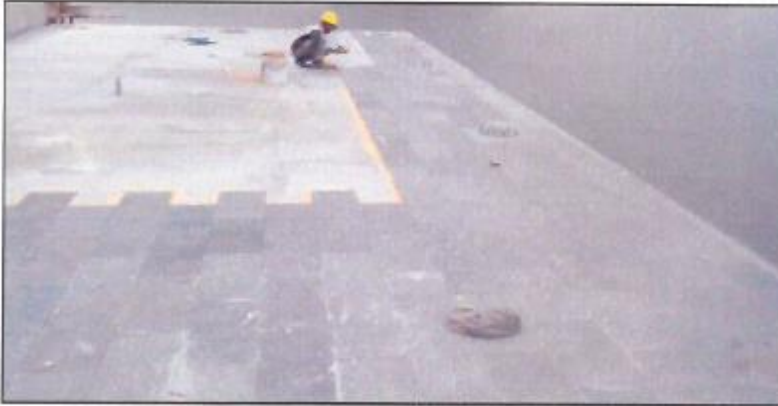
Paca de Muelle finalizada (resaltado los soportes para la instalación de los Noray los cuales servirán para el amarre de las embarcaciones).