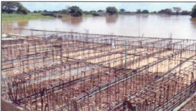
Armado de aceros para tarima de muelle en el tramo 4.