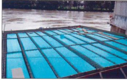
Instalación de formaleta para placa del Muelle.