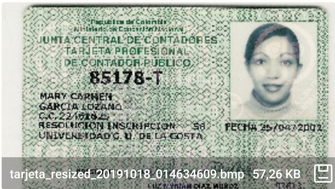
tarjeta_resized_20191018_014634609.bmp 57,26 KB